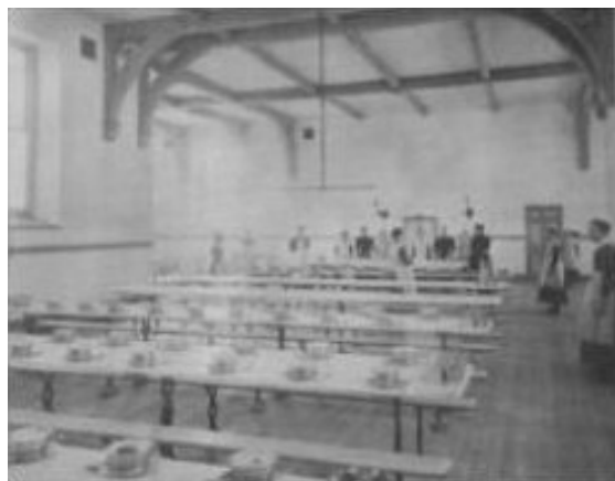
Réfectoire à Ashley Down

Chaque matin après le petit déjeuner il y avait un temps de lecture biblique et de prière, et chaque enfant recevait une Bible à la sortie de l'orphelinat avec un coffret d'étain contenant deux changements de vêtements. Les enfants étaient bien habillés et bien éduqués - Müller employa même un inspecteur d'école afin de maintenir un haut standard. En fait, beaucoup disent que les usines et les mines alentours ont été incapables d'obtenir suffisamment de travailleurs en raison de ses efforts dans l'apprentissage, la formation professionnelle, et les positions de service national pour les enfants en âge de quitter l'orphelinat.